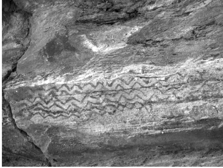
चित्र : लहरदार लकीरें, लखुडियार

(iii) पशु चित्र—पशु चित्रों में, एक लम्बे थूथन वाला जानवर, एक लोमड़ी और कई रंगों वाली छिपकली चित्रकारी के मुख्य विषय हैं।